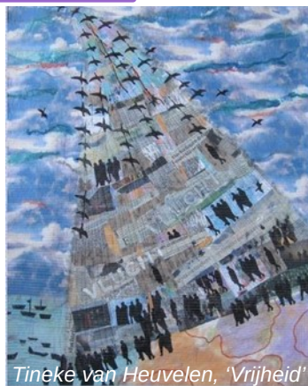
Tineke van Heuvelen, 'Vrijheid'

ik was de vogels jagend boven golven ik was de vissen vluchtend in de zee waar is mijn huis voorbij er was een huis - Greetje Grijpma