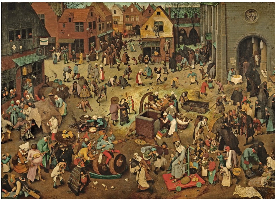
"De strijd tussen Vastenavond en Vasten", Pieter Bruegel de Oude